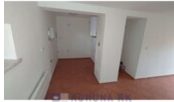
KORUNA RK REALITNÍ KANCELÁŘ