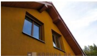
KORUNA RK REALITNÍ KANCELÁŘ