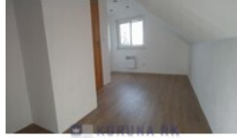
KORUNA RK REALITNÍ KANCELÁŘ