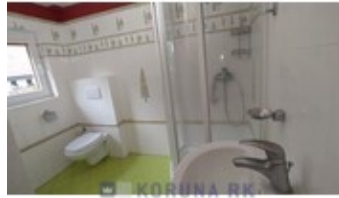
KORUNA RK REALITNÍ KANCELÁŘ