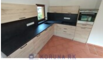
KORUNA RK REALITNÍ KANCELÁŘ