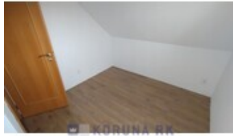
KORUNA RK REALITNÍ KANCELÁŘ