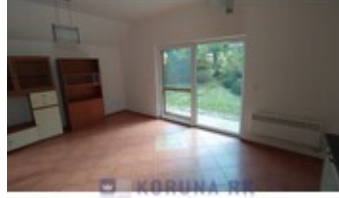
KORUNA RK REALITNÍ KANCELÁŘ