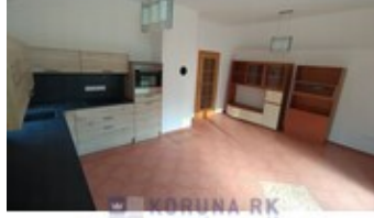
KORUNA RK REALITNÍ KANCELÁŘ